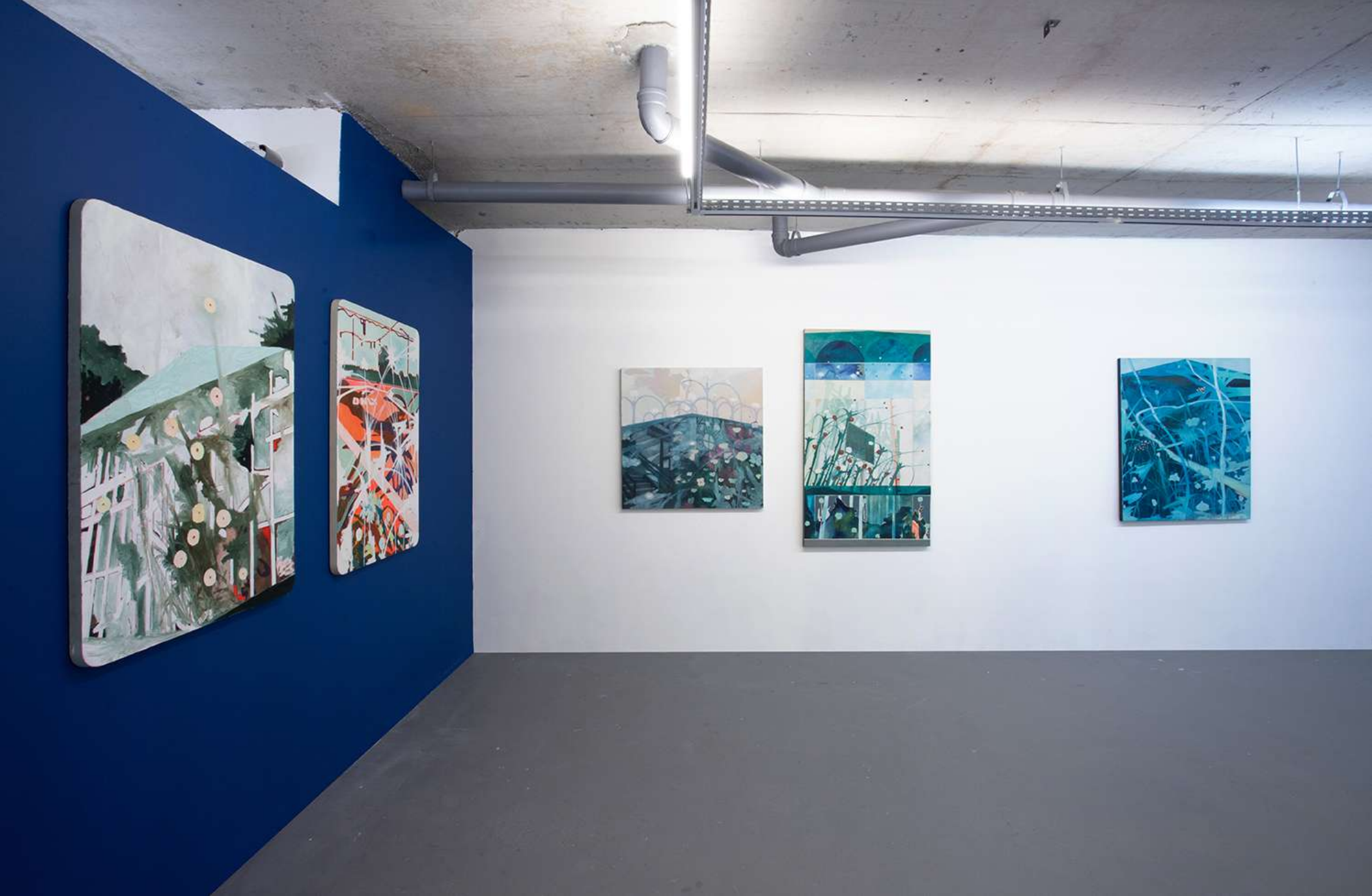
Vista da exposição individual - Entrespaços:Segundo ato. Abril/2026 - OMA Galeria. São Paulo - SP, Brasil.