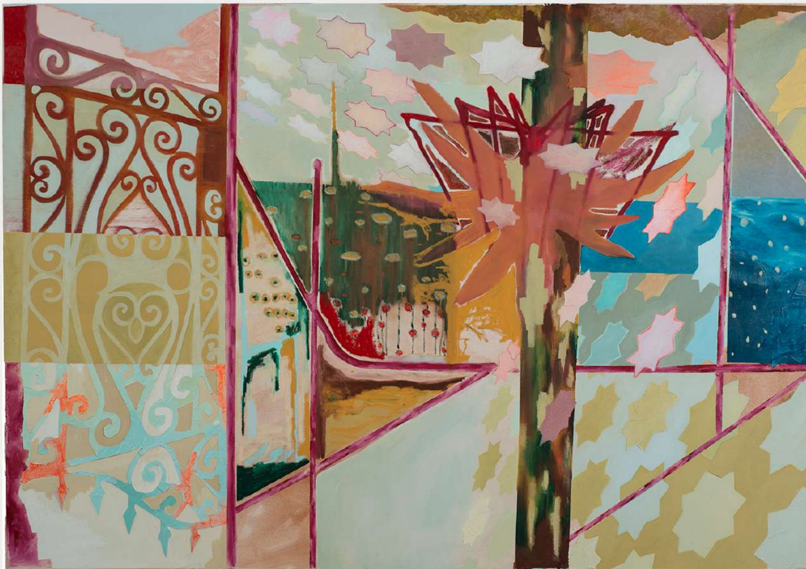
Metapaisagem número XVI, 2024. Óleo sobre tela. 140x200cm.