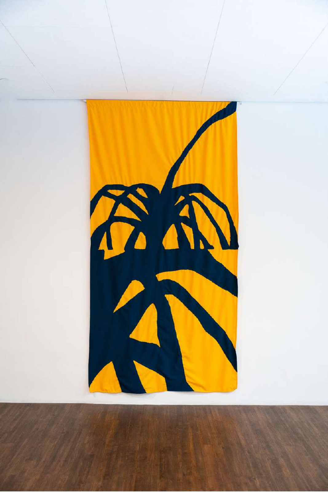
In n out I, 2023 Tecidos sobrepostos e costurados. 160x260cm