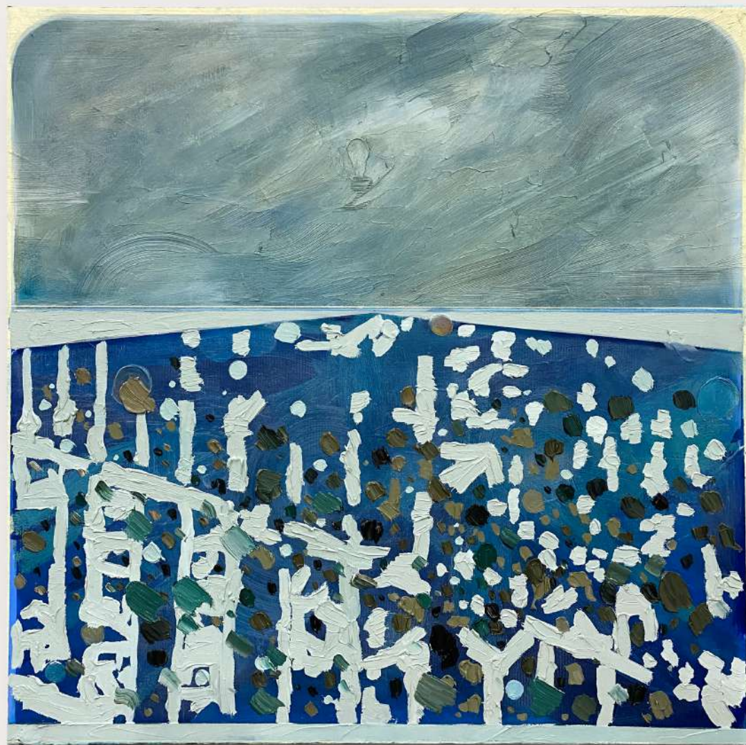
Metapaisagem número XXXVI, 2026. Óleo sobre tela. 60x60cm.