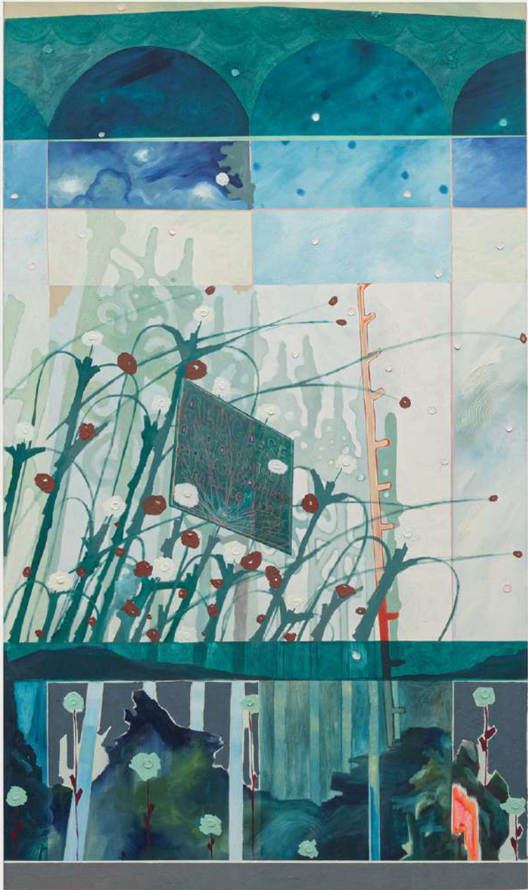
Metapaisagem número XXIV, 2025. Óleo sobre tela. 156x92cm.