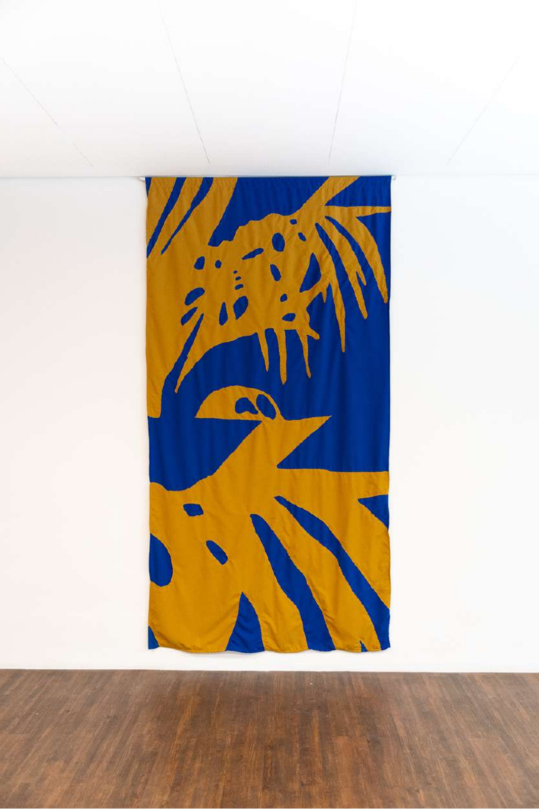
In n out II, 2023 Tecidos sobrepostos e costurados. 160x260cm