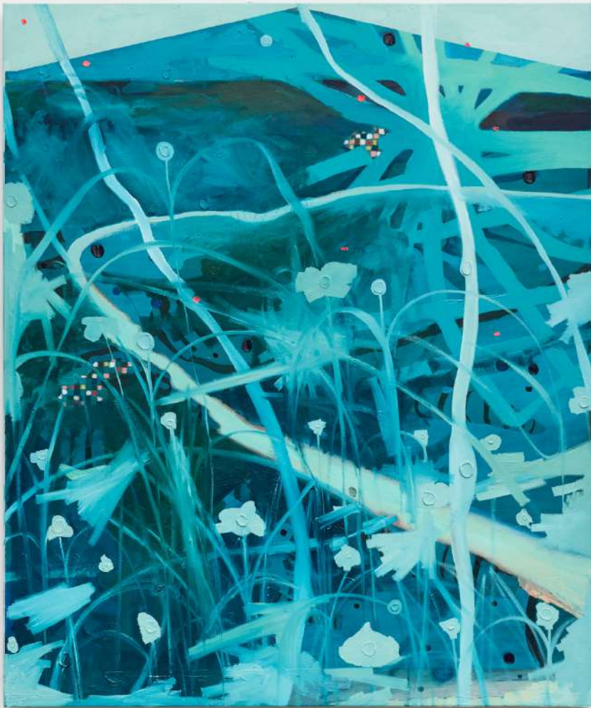
Metapaisagem número XXXII, 2019-2025. Óleo sobre tela. 120x100cm.