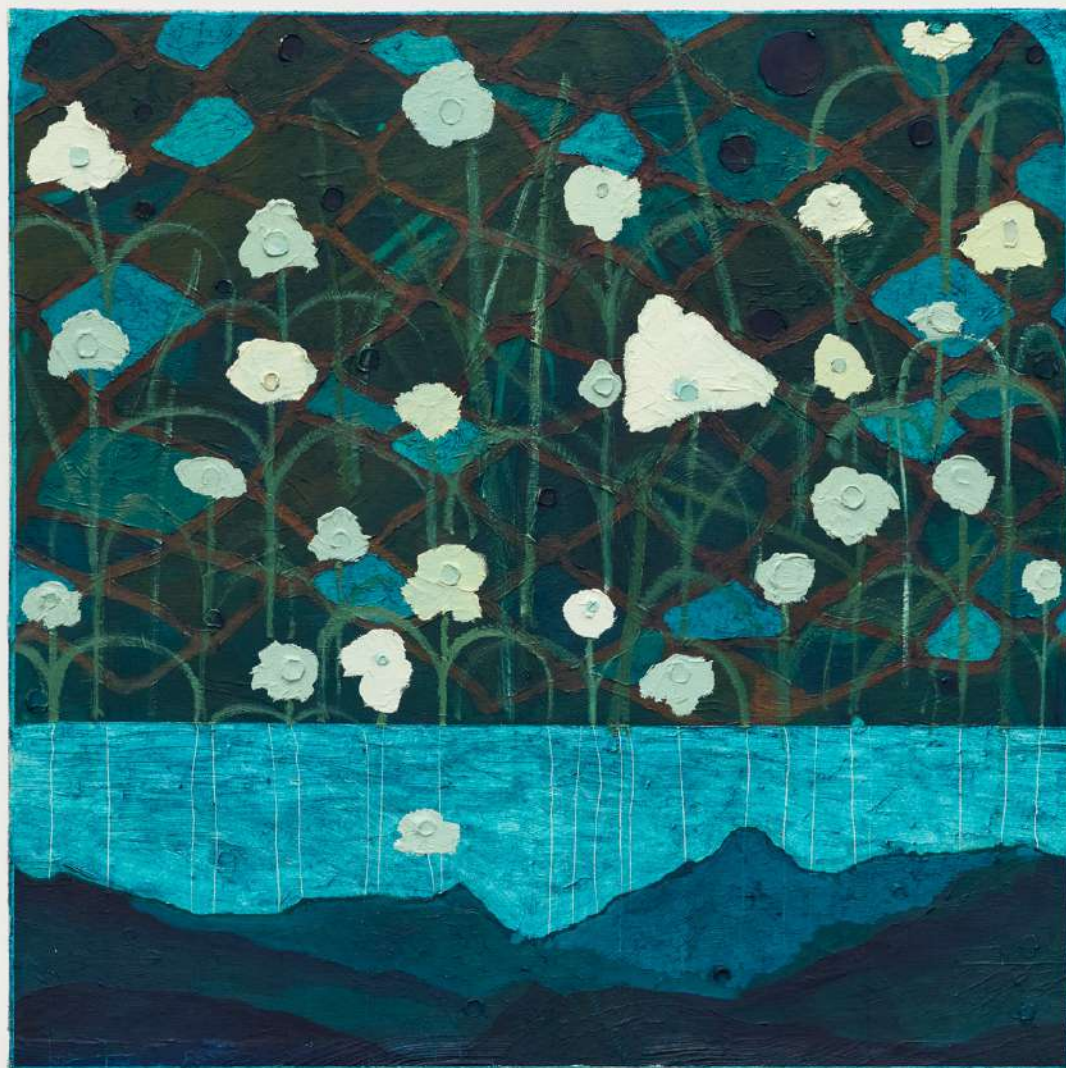
Metapaisagem número XXIX, 2025. Óleo sobre tela. 60x60cm.