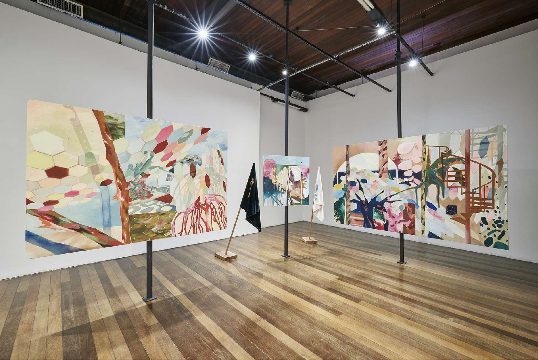
Vista da exposição individual: Entrespaços. Setembro/2024 - Centro cultural dos Correios. Rio de Janeiro, RJ - Brasil.