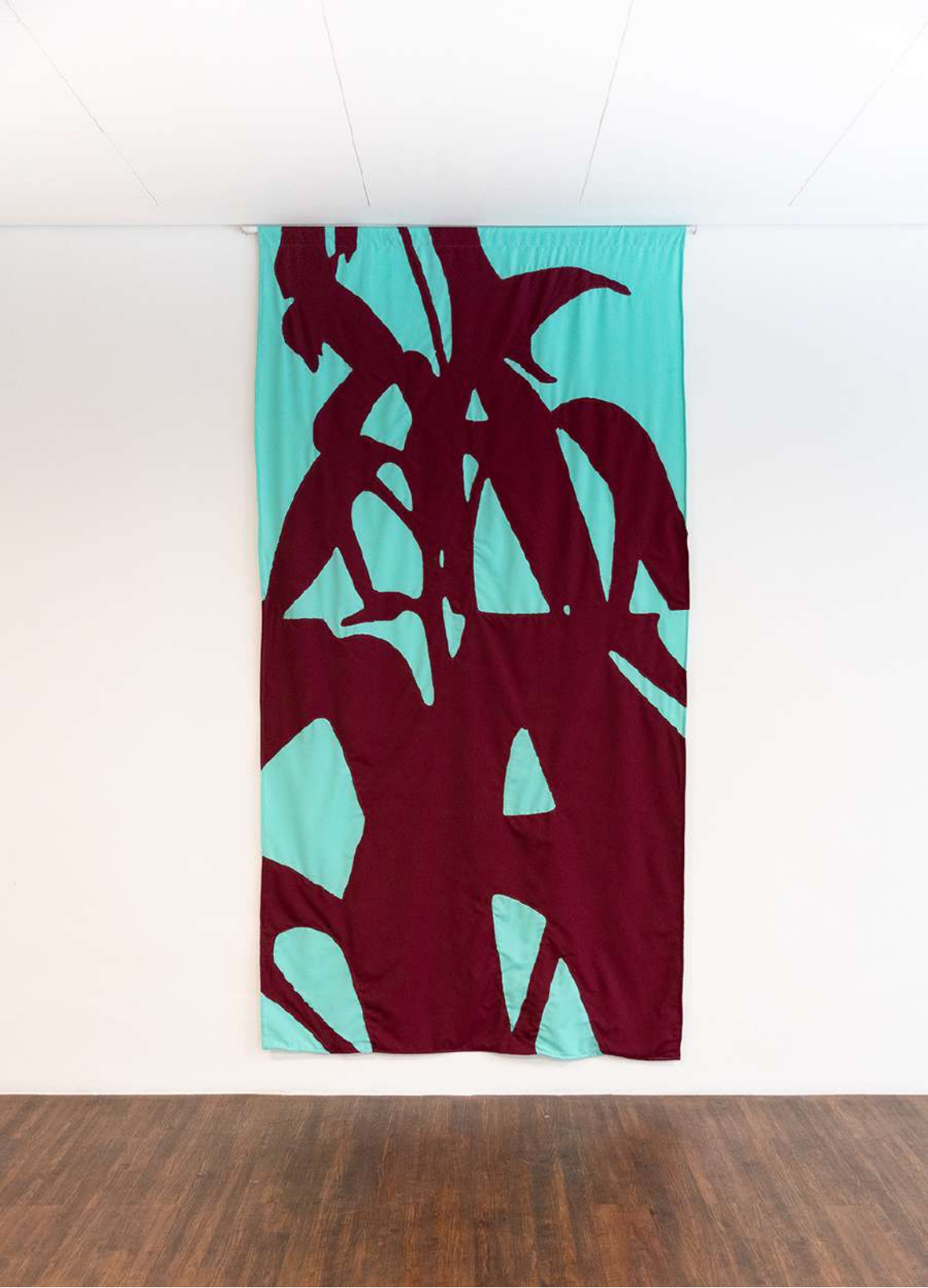
In n out III, 2023 Tecidos sobrepostos e costurados. 160x260cm