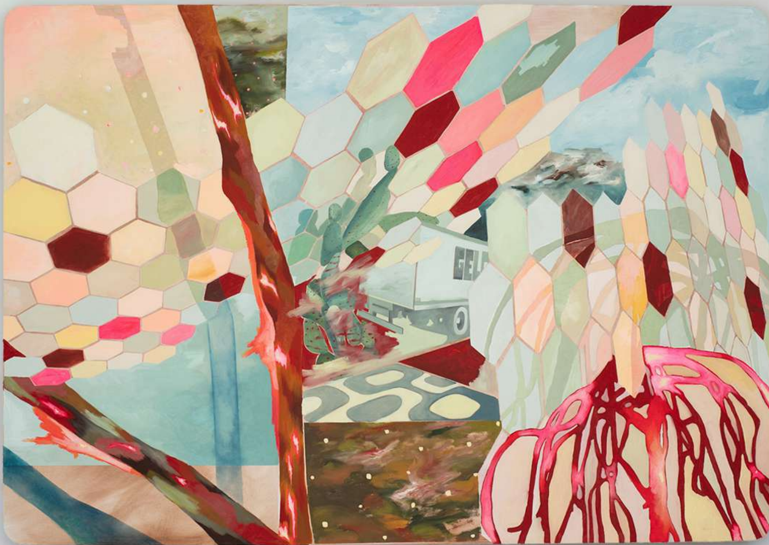
Metapaisagem número XVIII, 2024. Óleo sobre tela. 140x200 cm.