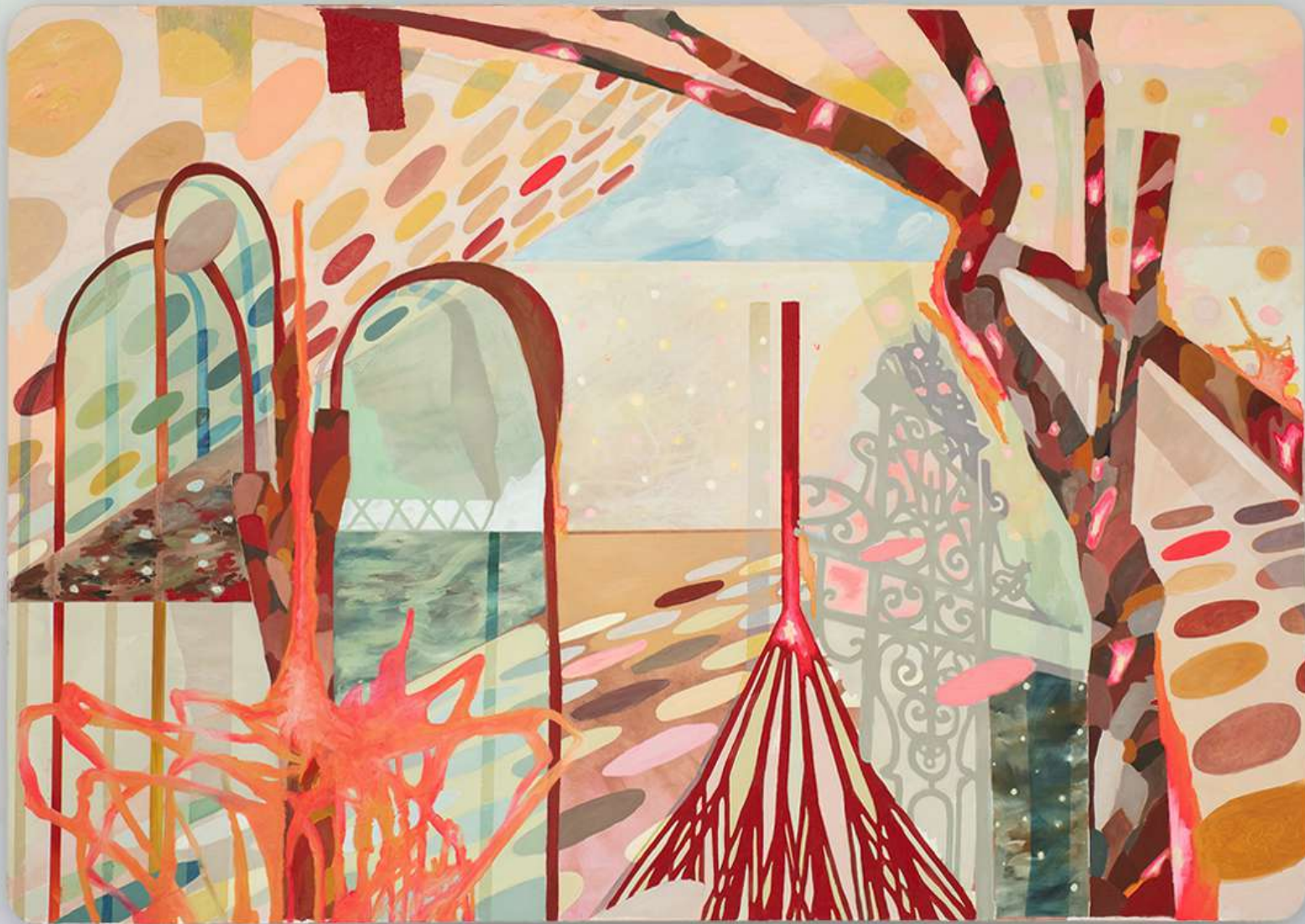
Metapaisagem número XVII, 2024. Óleo sobre tela. 140x200cm.