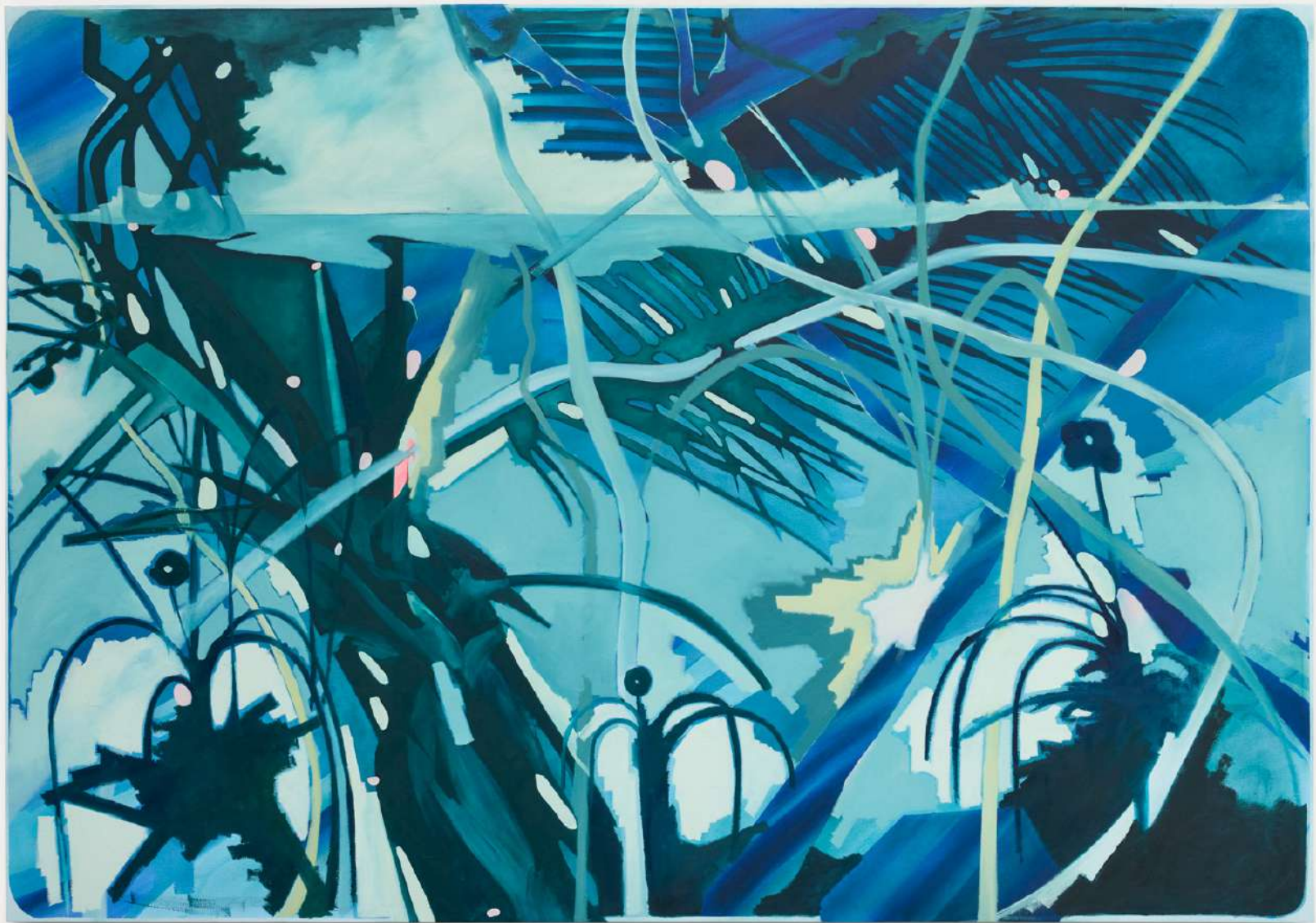
Metapaisagem número II, 2023-2025. Óleo sobre tela. 140x200cm.