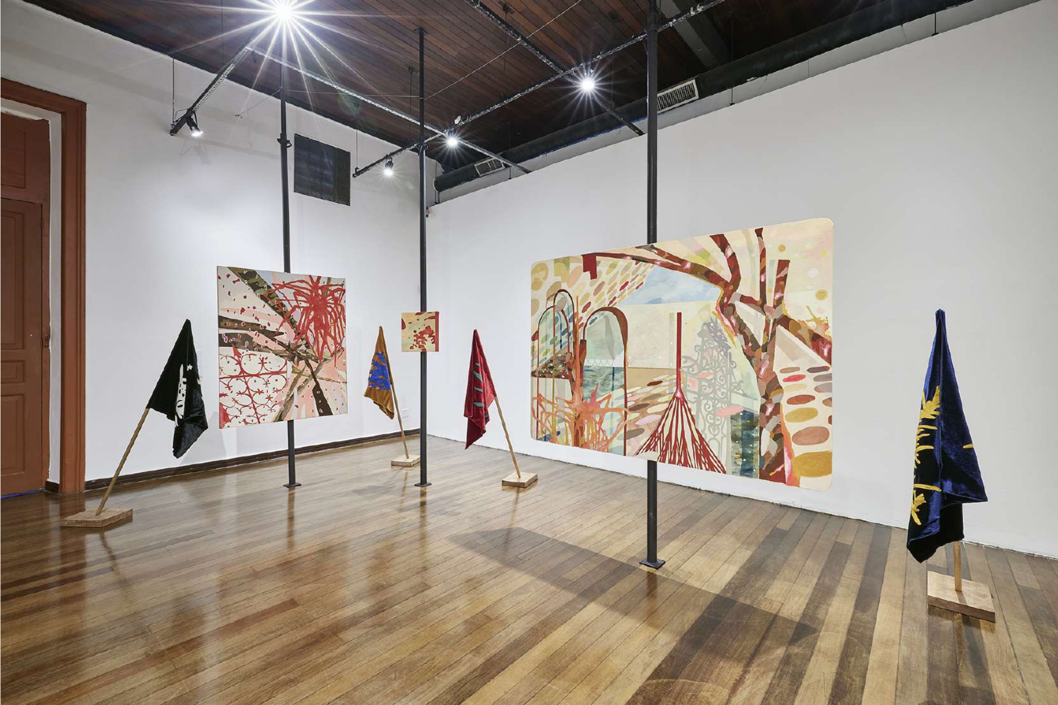
Vista da exposição individual: Entrespaços. Setembro/2024 - Centro cultural dos Correios. Rio de Janeiro, RJ - Brasil.