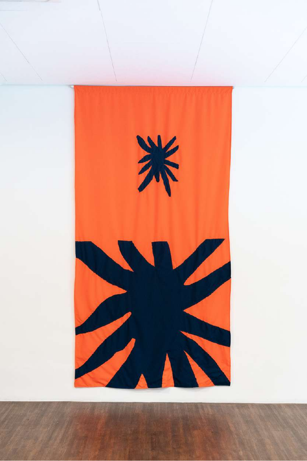
In n out IV, 2023 Tecidos sobrepostos e costurados. 160x260cm