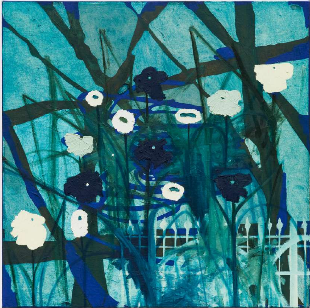
Metapaisagem número XXXIV, 2025. Óleo sobre tela. 60x60cm.