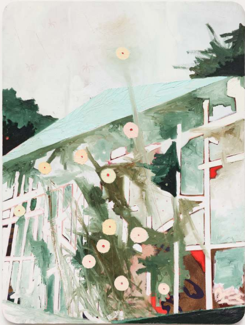
Metapaisagem número XXX, 2022-2025. Óleo sobre tela. 120x90cm.