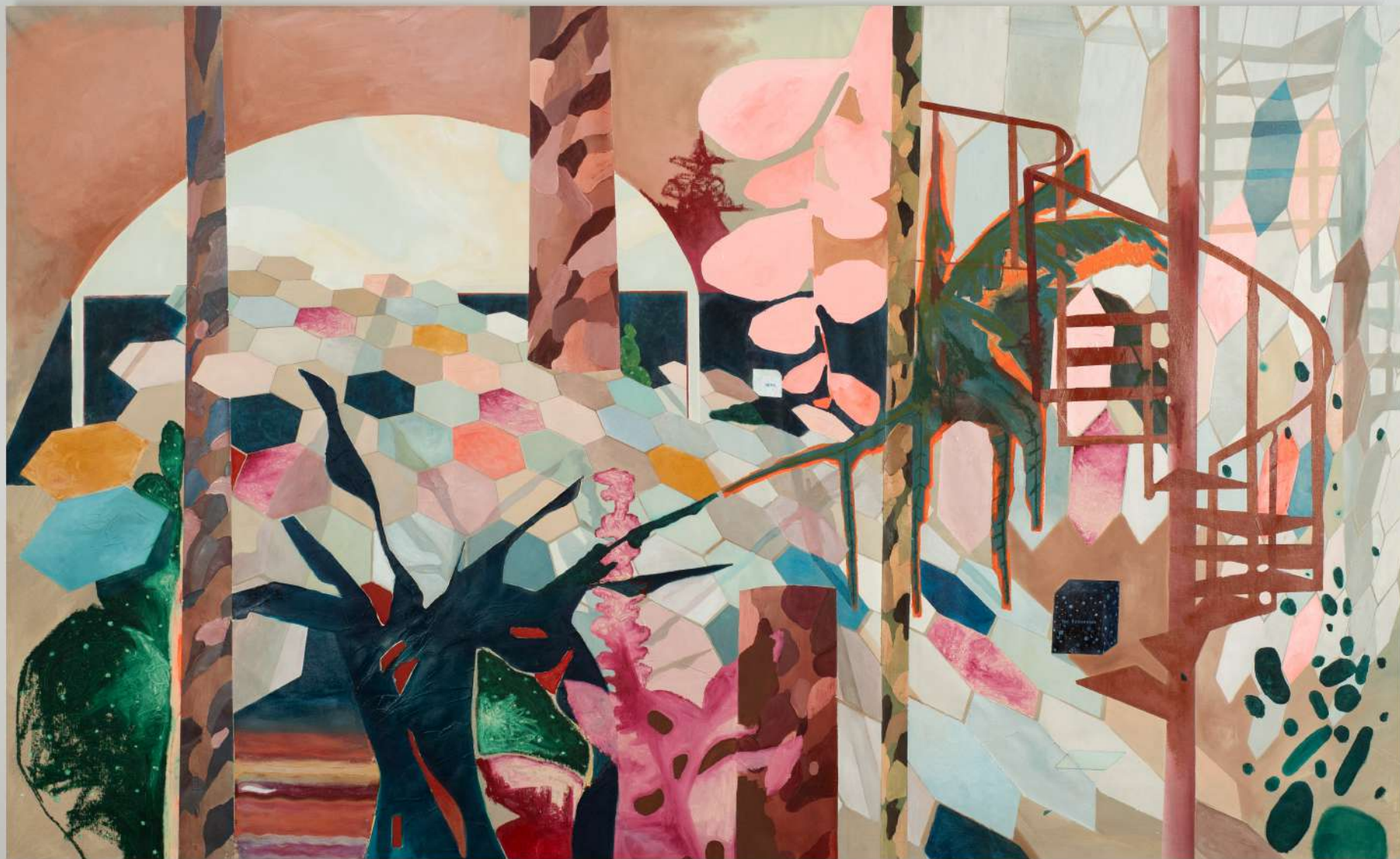
Metapaisagem número XV, 2024. Óleo sobre tela . 160x260cm.