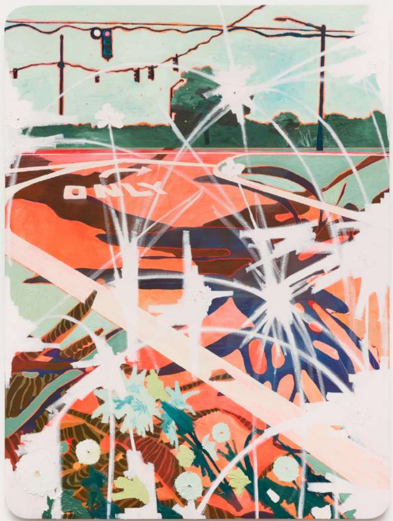
Metapaisagem número XXXIII, 2022-2025. Óleo sobre tela. 120x90cm.